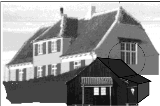
Hjørne af kiosktag i kant af vindue.