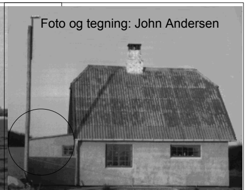
Træ-elmast med camping antenne i hjørnet af udbygning.